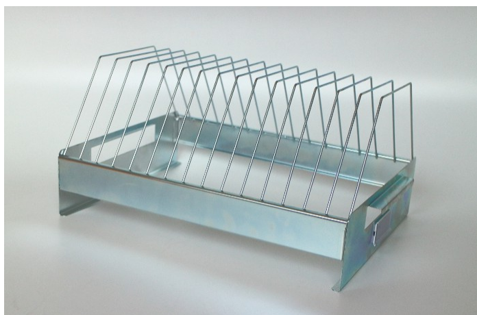
rezystancja pomiędzy punktami: R_{p-p} < 100 \text{ Ohm}